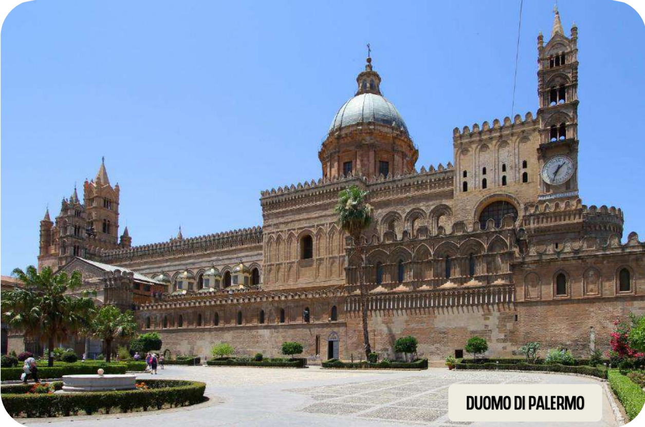
DUOMO DI PALERMO